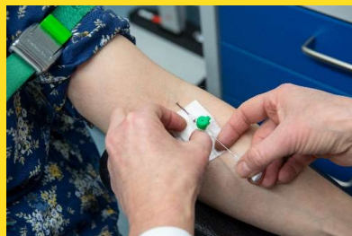
Näytteiden otto ja analyysit