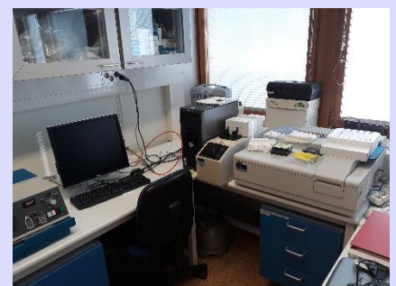
UV-Vis- spektrometri PerkinElmer Lambda 25