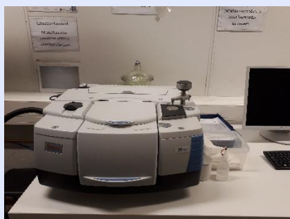
FTIR-spektrometri Thermo Nicolet iS50